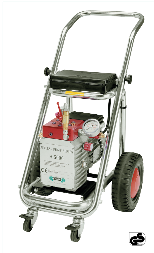
A5000T Airless Gerät mit elektrischem Motor