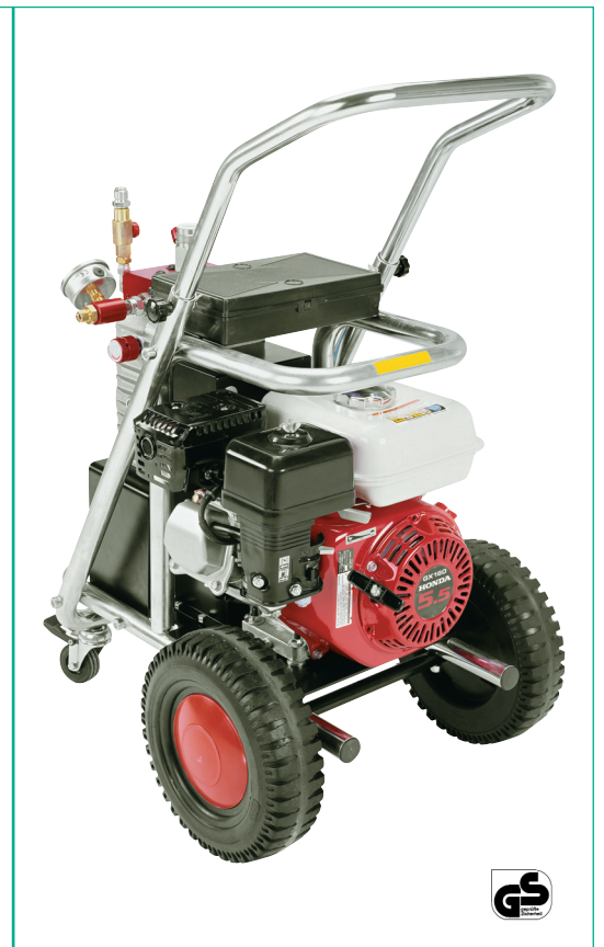
A5000G Airless Gerät mit benzinbetriebenem Motor